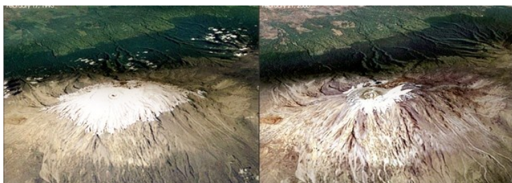
La couverture de glace du mont Kilimanjaro (Tanzanie) en 1913 et en 2000. La couverture de glace a diminué de 26 % depuis 2000.

L'Afrique doit s'adapter au changement climatique à une vitesse beaucoup plus grande et sur une échelle plus large que les pays riches, mais sans les ressources et la technologie nécessaires.